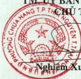
Nghiêm Xuân Quyết