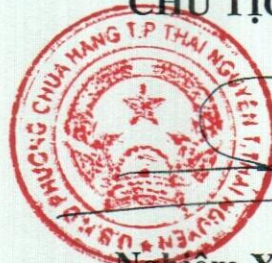
Nghiêm Xuân Quyết