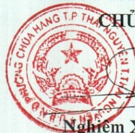
Nghiêm Xuân Quyết