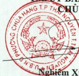
Nghiêm Xuân Quyết